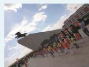
2009级赴锡盟镶黄旗实习