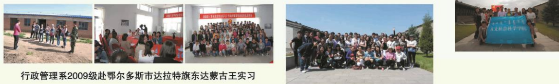
行政管理系2009级赴鄂尔多斯市达拉特旗东达蒙古王实习