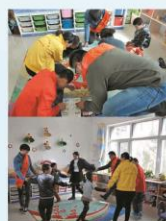
2014年国际社工日 于儿童福利院活动