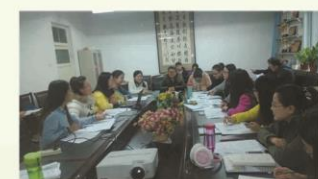
行政管理系《公共经济学》课程辩论赛