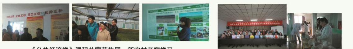
《公共经济学》课程赴蒙草集团、新农村考察学习

行政管理系不断加强实训基地建设。校内设有行政管理模拟实验室的同时，积极构建校外实训基地。2011年组织学生赴赤峰市阿鲁科尔沁旗实习，2012年赴鄂尔多斯市达拉特旗东达蒙古王集团实习，2013、2014年赴土左旗察素齐镇实习。