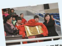
拓展社工专业校外实习基地

2013年成立了“青苗社工服务站”，2014年与鄂尔多斯鑫海颐和院、中华情老年公寓建立了长期的实践教学基地。校内外实践基地的拓展，为社工专业的师生从事专业咨询、社会救助等方面搭建了重要的平台。