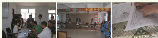
行政管理系2008级赴赤峰市阿鲁科尔沁旗实习