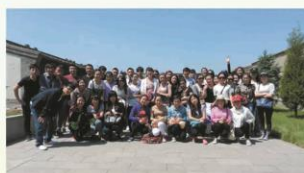
行政管理系2010级赴土左旗实习