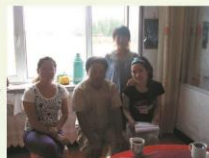
行政管理系2008级 赴赤峰市阿鲁科尔沁旗实习