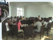
2006级赴锡林浩特市 农牧业局和社区实习